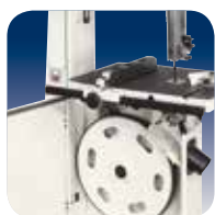
Volani in Ghisa solidità