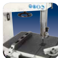
Protezioni massima sicurezza